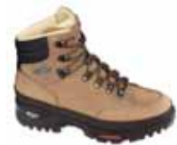
Lowa - Lady Sport ↑