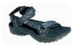
Teva - M's terra Fi m/s ↑