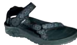
Teva - M's Cross Terra ↑