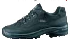
Meindl - Magna ↑