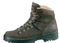
Meindl - Wales ↑