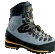
La Sportiva - Nepal Trek Women ↑