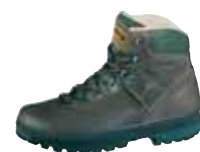
Meindl - Borneo Pro MFS ↑