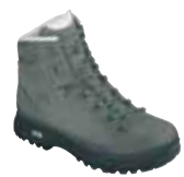
Hanwag - Peru ↑