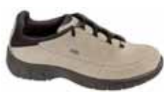
Lowa - Rhodos II lo ↑