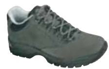
Hanwag - Robin ↑