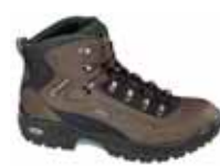
Lowa - Renegade II GTX mid ↑