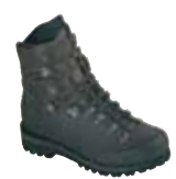
Hanwag - Alaska Top GTX ↑