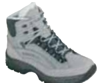
Hanwag - Canyon ↑