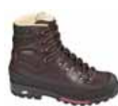
Lowa - Baffin ↑