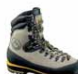
La Sportiva - Nepal Trek ↑