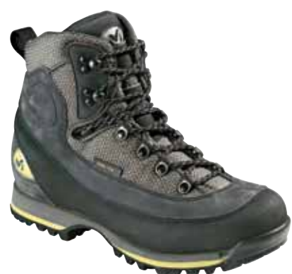
Millet - Trek GTX ↑