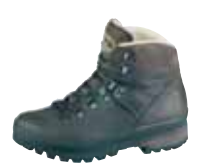
Meindl - Borneo Lady MFS ↑