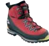
Millet - Rock & Ice ↑