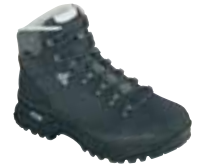
Hanwag - Lima Lady Gore ↑