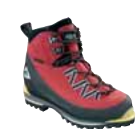
Millet - Rock &amp; Ice ↑