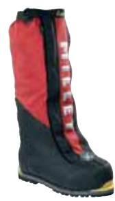
Millet - Everest Boot ↑