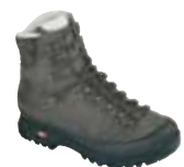
Hanwag - Yukon ↑