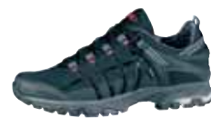
Meindl - XO Men XCR® ↑