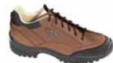
Lowa - Pinto ↑