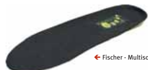
← Fischer - Multisorb

De Multisorb is een inlegzool met een zeer groot schokdempend vermogen. De unieke vormgeving zorgt voor ondersteuning van de achter- en middenvoet, optimale drukontlasting, drukverdeling en schokdemping. Aanbevolen voor extra schokdemping en comfort voor de gehele voet en bij vermoeide en branderige voeten.