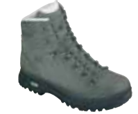
Hanwag - Peru Lady ↑