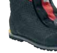
Millet - Everest Boot ↑