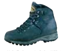
Meindl - Burma Lady Pro MFS ↑