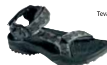
Teva - M's Terra Fi ↑