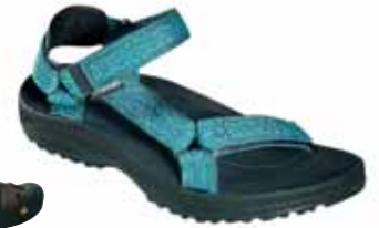
↑ Teva - w's hurricane II