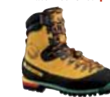
La Sportiva - Nepal Extreme ↑