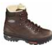
Lowa - Trekker ↑