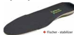
← Fischer - stabilizer

De Stabilizer biedt anatomische ondersteuning in het gewricht (smalle gedeelte van de zool) en in de achtervoet! De kunststof heelpcup zorgt voor de stabiliteit en ondersteuning terwijl het duurzame EVA materiaal zorgt voor schokdemping en drukverdeling. Aanbevolen voor goede ondersteuning en stabilisatie van achter- en middenvoet en voor drukverdeling van de gehele voet