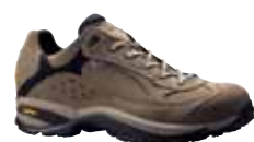
Asolo - Vapor XCR® ↑