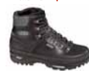
Lowa - Ranger GTX ↑