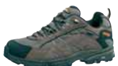
Meindl - Magic Men 2.0 XCR® ↑