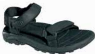
← Teva - Sidewalk