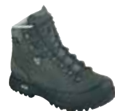
Hanwag - Forest GTX ↑