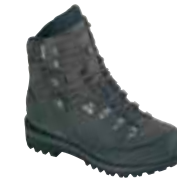
Hanwag - Alaska Top lady GTX ↑