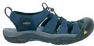
← Keen - Newport H2