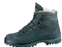
Meindl - Colorado ↑