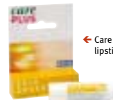
← Care Plus - Skin-saver lipstick SFP 25