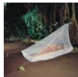
↑ Care Plus® - Travelnet Wedge