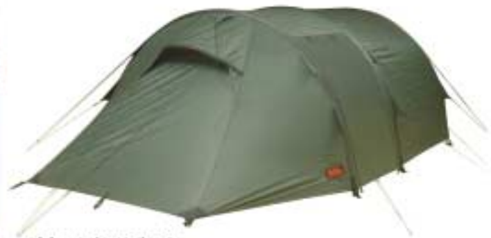
Akka R/S Light 3