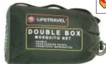
↑ Life Travel - Box 2