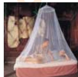
↑ Care Plus® - Travelnet Bell

Klamboes treft u aan in de volgende formaten, rechthoekige, rond en wigvormig.