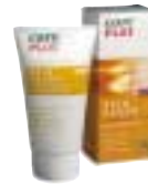
Care Plus - Skin-saver SunProtection SFP 10 →