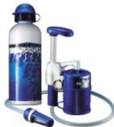
↑ Sigg First Need - General Ecology