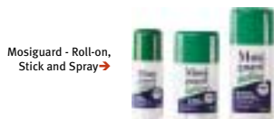
Mosiguard - Roll-on, Stick and Spray →

Spray 100ml, uit natuurlijke bestanddelen opgebouwd (41167) € 9,50 Natural Stick, 50 ml (41168) € 9,50 Natural Roll-on, 60 ml (41169) € 9,50