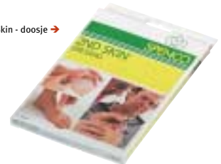
Second Skin - doosje →