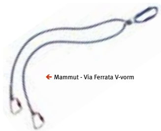
← Mammut - Via Ferrata V-vorm