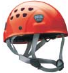
← Petzl - Ecrin Roc