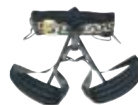
↑ Mammut - New Wave