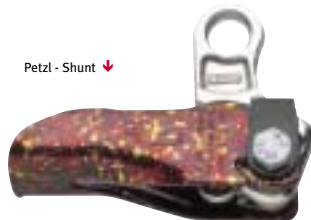
Petzl - Shunt ↓