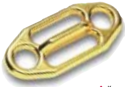
↑ Kong - Gi-Gi