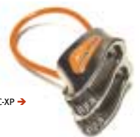
Black Diamond - ATC-XP →