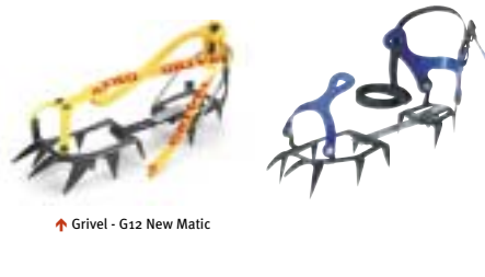
↑ Grivel - G12 New Matic