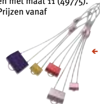
← Black Diamond - Hexentric Nuts