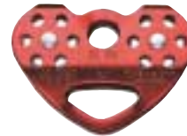
← Petzl - P21 Tandem