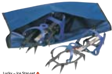
Lucky - Ice Star-set ↑