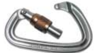
↑ Black Diamond - Positron Screwgate