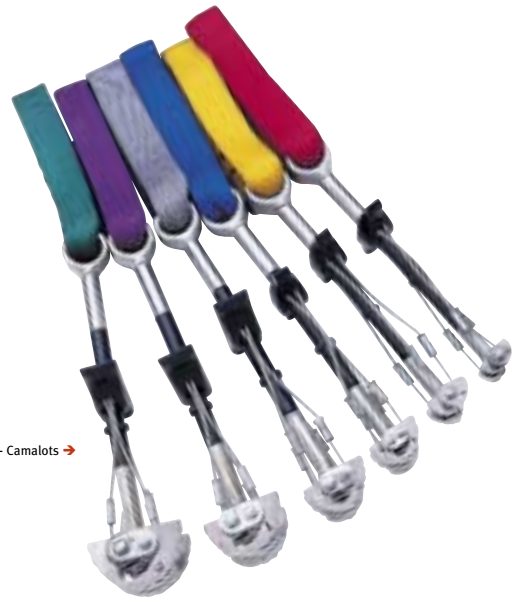
Black Diamond - Camalots →