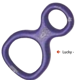
← Lucky - abseilacht

Het woord HMS is een acroniem vanuit het Duits en staat voor Halb Mastwurf Sicherung (halve mastworp). Een HMS wordt voornamelijk gebruikt om een naklimmer te zekeren. Zekeren van een naklimmersval kost met de HMS minder kracht dan met een abseilacht. Door de hoge remwerking van de HMS-knoop is de HMS ook aan te raden om een voor-klimmer te zekeren in alpien terrein als er weinig tussenzekerings te leggen zijn. Een nadeel van de HMS is dat het touw kringelt. Prijzen vanaf € 9,99. U vindt ze in de tabel van de karabijnen op de pagina hiernaast.