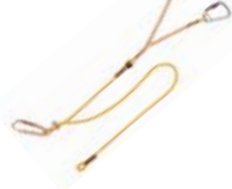
Mammut - Via Ferrata Y-vorm →