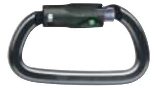
↑ Petzl - Am'D BALL LOCK