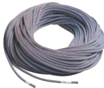
↑ Mammut - Revelation 9 mm

Een dubbeltouw moet gezien worden als twee losse touwen. In tussenzekerings moet telkens een enkele streng ingehangen worden. Dit doet u om-en-om. In tegenstelling tot het tweelingtouw is dubbeltouw veel gebruikt en iets dikker (8 tot 9 mm). Het voordeel van een dubbeltouw is dat een voor klimmer twee naklimmers gelijktijdig kan laten nakomen (3-persoonstouwgroep) en gebruik van één enkele streng op de gletsjer is mogelijk.