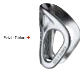
Petzl - Tibloc →