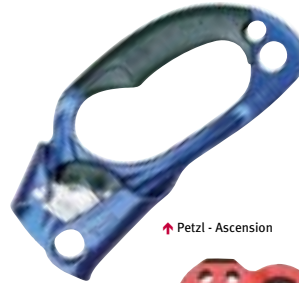
↑ Petzl - Ascension