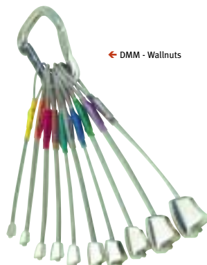
← DMM - Wallnuts

Wat klemt waar? Wij adviseren u graag bij uw keuze. Klemblokken (in Engelstalige landen: nuts) maken het mogelijk een tussenzekering aan te leggen zonder iets aan de rots te verminken. Deze "schone" manier van klimmen is vooral in Groot-Brittannië zeer populair, maar wordt natuurlijk ook veelvuldig toegepast bij het klimmen in de Alpen. Het klemblok wordt aangebracht in een taps toelopend stuk van een spleet. Het klemt zich onder belasting vast in de richting van de versmaling. De nummering van de klemblokken van de verschillende merken loopt nogal uiteen. Vergelijken wordt daardoor lastig.