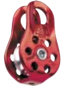
Petzl - Pos Katrol Fixe ↑