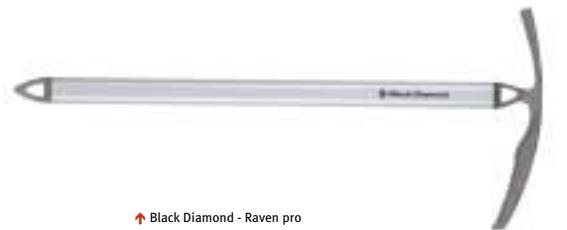
↑ Black Diamond - Raven pro