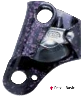
↑ Petzl - Basic