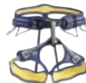
↑ Petzl - Calidris