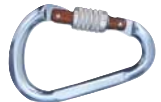
↑ Lucky - HMS met schroef