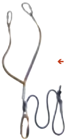
← Petzl - ZyperY vertigo