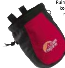
← Lowe Alpine - Zipper Dipper

Ruime pofzak met aantrekkkoordje en tanka, inclusief ritszakje voor sleutels. (65194) € 11,95