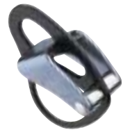
Petzl - Reversino →

De ATC is ook een acroniem vanuit het Engels en staat voor Air Traffic Controller. Een ATC is eigenlijk een moderne uitvoering van de Stichplatte. De ATC is erg geschikt om een voorklimmer te zekeren, zeker bij het gebruik van een dubbeltouw, omdat beide touwen afzonderlijk uitgegeven kunnen worden. Een voordeel van de ATC is dat het touw minder kringelt dan bij een abseilacht of HMS. Gebruik de ATC (en Stichplatte) voor het abseilen en, als men goed oplet, om een voorklimmer te zekeren. Voor het zekeren van een naklimmer is de ATC niet geschikt, omdat de remwerking te gering is. Daarvoor zijn de abseilacht, de HMS en de Magic Plate beter geschikt. Naast de gewone ATC is er nu ook de ATC-XP, waar bij de XP voor Extra Power staat. De ATC-XP kan een extra remwerking van 30-40 procent genereren. Afhankelijk van de diameter van het touw kiest u over welke kant gezekeerd moet worden. Verder hebben wij van Camp de Shell en van D.M.M. de bugette.