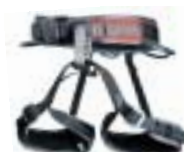
↑ Black Diamond - Momentum AL