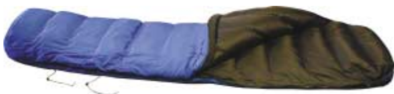
Demmenie Sport - 5800M CE ↑