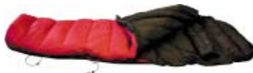
Demmenie Sport - 6800M CE ↑

N.B. Omdat de Demmenie Sport-slaapzakken met de hand worden gemaakt, kunnen de gewichten afwijken van de genoemde gewichten in de tabel. Ook de materiaalkeuze bepaalt het uiteindelijke gewicht. In de tabel staan standaardvoorbeelden. Wij streven ernaar de in de tabel genoemde modellen op voorraad te hebben.