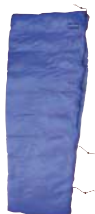
↑ Demmenie Sport - 3800 Taps CE

Hier is het taps toelopende dekenmodel uitgebreid met een capuchon. De rits loopt door tot onder de voet. Standaard voorzien van een antitochtslurf langs de rits en twee compressie-elastieken. De vulling bestaat uit ganzendons met een vulkracht van 700+ (5800 Taps CE). Dit model is aanritsbaar mits er een rechter- en een linkermodel wordt gebruikt en deze wordt voorzien van een extra voet-koppelrits. Hij wordt geleverd met foedraal en bewaarzak.