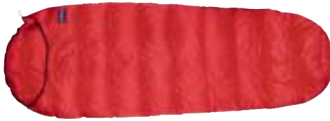
Demmenie Sport - Travel s800M

Slaapzakken zijn er in allerlei soorten, maten en prijzen. Het belangrijkste aan een slaapzak is dat hij voldoende isoleert. De isolatiewaarde van een slaapzak hangt ons inziens af van de volgende elementen: de vulling, het vulgewicht, de vulkracht, het materiaal van het tijk, het model en de constructie.