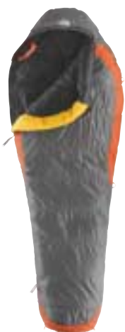
The North Face - Cat's Meow ↑