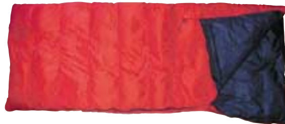
Demmenie Sport - Deken 2800D

Bij donzen vullingen spreekt men van fillpower of vulkracht. Hoe hoger de vulkracht, hoe hoger de isolatiewaarde, immers het hogere volume zorgt ervoor dat het dons veel stilstaande lucht kan vasthouden. En dat is precies waar het om gaat bij isolatie. De waarde van de vulkracht wordt aangeduid met CUIN, kubieke inch per ounce. Het geeft het volume aan van het dons. De CUIN-waarden liggen tussen de 300 en 750. Eigenlijk geeft de vulkracht de isolatiewaarde van dons het beste aan en dus over de kwaliteit van de dons-vlokken.