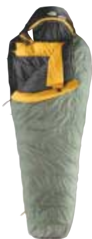
↑ The North Face - Snowshoe