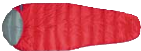
↑ Demmenie Sport - Travel 800M

Een nieuw model in de serie is de travel 600M SZ, gebaseerd op de travel 800, echter met een korte rits van 1 meter. Waarbij de isolatiewaarde van de mat en het dons optimaal gecombineerd wordt. De isolatie van de bodem komt voor 100% op rekening van de mat, hier bestaat de slaapzak dan ook uit een enkel laag zonder dons. De dons laag verzorgt de isolatie aan de "bovenkant" ca. 3/4 van de slaapzak. De insteekklussen in de bodem van de slaapzak houden de mat op zijn plaats. Deze zijn op maat gemaakt voor de nieuwe superlichte tapse matten uit de Fast & light serie van Therm-a-rest (zie pagina 82). Een mat van 180 cm weegt slechts 570 gram en de slaapzak schatten we op ca. 630 gram, samen dus 1200 gram. De defnieve uitvoering verwachten we medio mei aan te kunnen bieden. Ook dan is het exacte gewicht bekend.