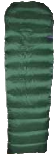
Demmenie Sport - 5800T

Het vulgewicht van een slaapzak is afhankelijk van het beoogde temperatuurbereik. Kort gezegd, hoe meer vulling hoe warmer de slaapzak. De hoogte van het vulgewicht hangt af van het isolatievermogen van de vulling, maar ook van de afmetingen van de slaapzak. Een kinderslaapzakje en een grote slaapzak kunnen dezelfde isolatiewaarde hebben, terwijl het kinderslaapzakje daar minder vulling voor nodig heeft, simpelweg omdat hij minder oppervlakte heeft.