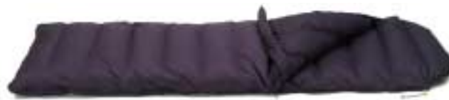
↑ Demmenie Sport - 5800D

Tip: Dit model is aanritsbaar aan een ander Demmenie Sport dekenmodel, maar ook aan de daarvoor speciaal gemaakte synthetisch gevulde