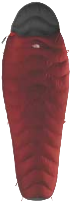
The North Face - Superlight ↓