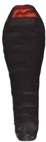
↑ Fennek - Yukon winter Bij ons blauw-rood