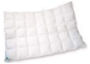
Dekbed uit de Lima-serie ↑

Deze dekbedden zijn uitgevoerd met een smalle rand die voorzien zijn van knoopsgaten. Met behulp van de bijgeleverde manchetknopen kunt u dan ook alle dekbedden uit deze serie aan elkaar koppelen tot de ideale combinatie voor U ontstaat. De tijk is een fijn geweven 100% katoen met een eigen gewicht van 105 g/m 2 . Gevuld met een hoogwaardige zilvergrijze volgroeide 90% ganzendons. Een extra aandachtspunt voor de Duo uitvoering; deze wordt geleverd met een dun zomermodel en een medium dikte voor- en najaarsmodel, die te samen een prima wintermodel vormen.