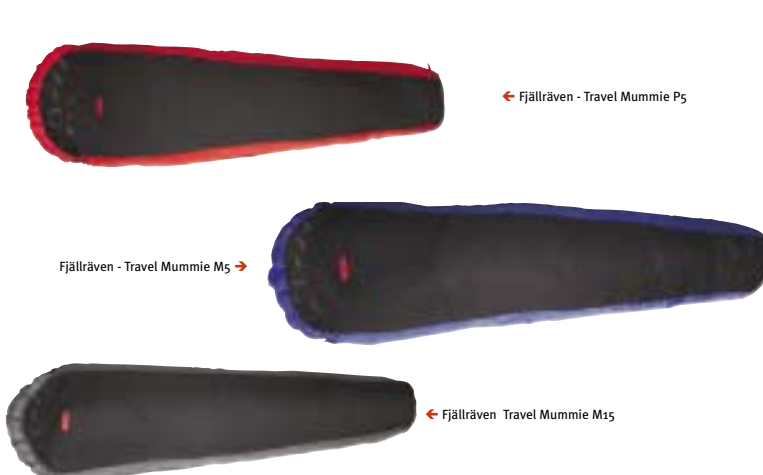
← Fjällräven - Travel Mummie P5