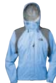
The North Face - Flight Jacket ↑