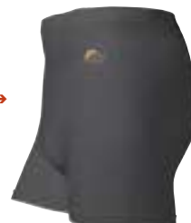
Lowe Alpine - Dryflo Lightweight Briefs →