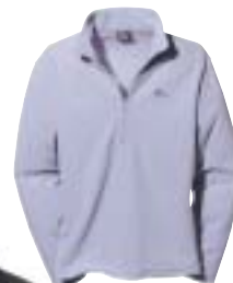
Lowe Alpine - Micro Grid Top →