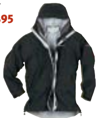
Berghaus - Suillivan ↑