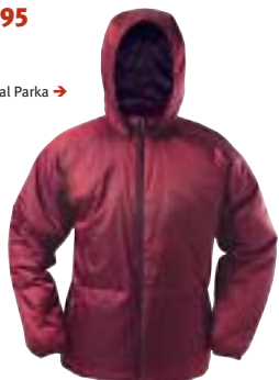
Go lite - Coal Parka →