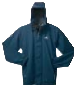
Millet - Oslo Zip In Jacket ↑