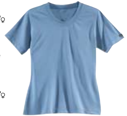
↑ Vaude - Mikeli