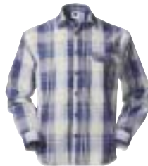
↑ Mammut - Gröden shirt