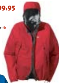
Low Alpine - Rush Jacket →