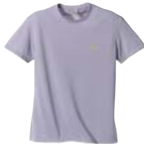
↑ Lowe Alpine - Dryflo Lightweight Crewneck Short Sleeve (ondergoed)

Prettig om te weten dat wij veel technische kleding hebben, maar wat is het juiste artikel voor U? Als leidraad gebruiken we voor de meeste buitensportactiviteiten (reizen, wandelen, trekking, en bergsporten) het drielagensysteem. Een systeem waarbij u zich in drie lagen en met zo min mogelijk artikelen, zo goed mogelijk kunt beschermen tegen de elementen.