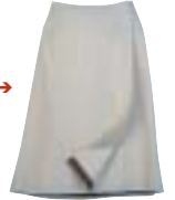
Berghaus - Long Reach Skirt →