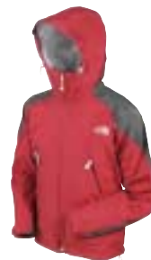
The North Face - Atmosphere Jacket ↑