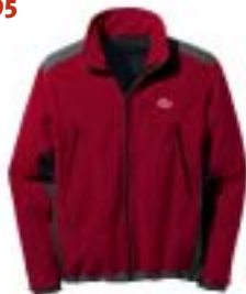
Lowe Alpine - Whirlwind Jacket ↑