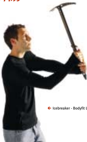
← Icebreaker - Bodyfit Long sleeved crewe