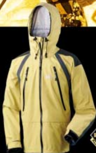
K JACKET 100% Protection (GORE TEX © XDR Stretch & Kevlar®)