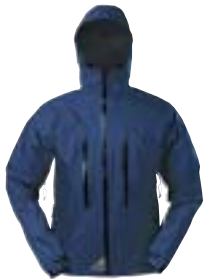
GoLite - Phantom Jacket ↑