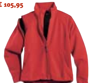
Vaude - Silvercreek Jacket →