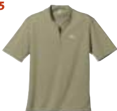
Lowe Alpine - Dryflo Snap Henley ↑