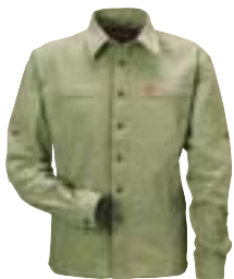
↑ Fjällräven - Marjoram Shirt