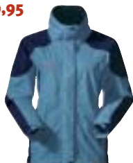
↑ Mammut - Venus XCR Jacket