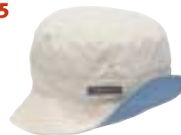
↑ Berghaus - Outback Hat