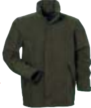
Fjällräven - Texas Jacket →