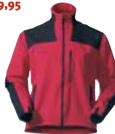
Mammut - Ultimate Pro Jacket ↑