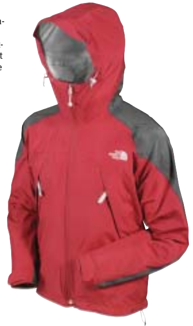
The North Face - Atmosphere Jacket ↓ (buitenlaag)

Deze laag kent nu een nieuwe groep: soft-shell. Wij zien soft-shell als een beschermend en goed ventilerend kledingstuk dat niet waterdicht is. Aldus een andere laag dan de waterdichte buitenkleding. Tevens is ons standpunt dat wij met Gore WINDSTOPPER® en Malden Windbloc producten al jaren invulling te geven aan het nu als nieuw gebrachte fenomeen 'soft-shell'.