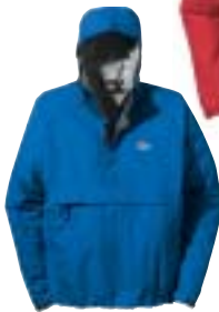
↑ Low Alpine - Rush Anorak