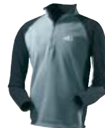
Millet - Air Stretch Top ↑