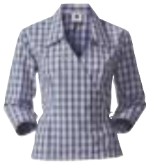
↑ Mammut - Aosta Shirt