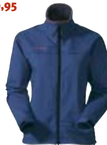
Mammut - Ozone Women Jacket ↑