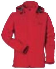
↑ Fjällräven - Lina Jacket