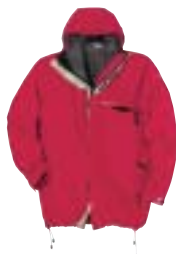
Berghaus - Paclite Pro Jacket ↑