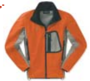
Mountain Hardware - Alchemy Jacket ↑