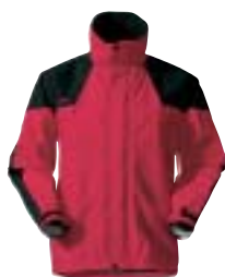
Mammut - Logan XCR Jacket ↑