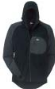
Lowe Alpine - Warm Zone Ninja Hoody ↑