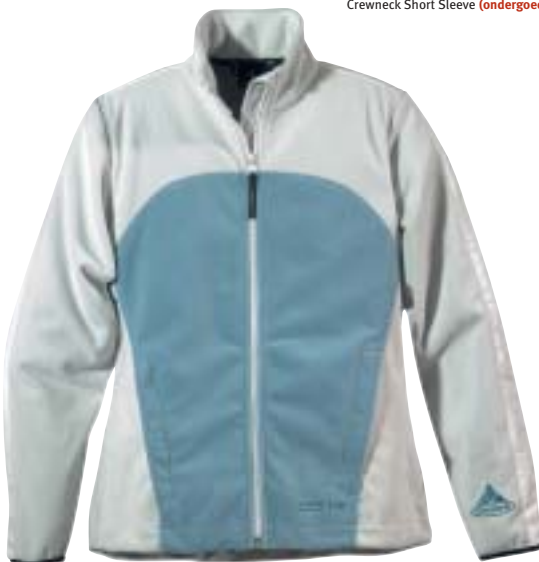
↑ Vaude - Tanami Jacket (isolatie)

De onderste, laag bestaat uit stoffen die vocht zo goed mogelijk verwerken. Deze laag wordt dan ook wel vochtregulerend of thermisch ondergoed genoemd. Doordat deze laag de huid zo droog mogelijk houdt, wordt de afkoelperiode beperkt en een behaaglijk gevoel her-