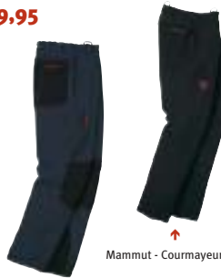
Mammut - Courmayeur Pant dames