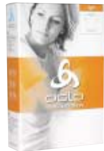
Odlo - Light Shirt Short Sleeve →