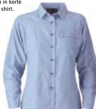
Mountain Hardwear - Excursion Long Sleeved Shirt Women ↑