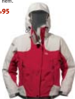
Low Alpine - Emotion Jacket ↑