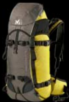
PELTREY 40 Commitment and performance