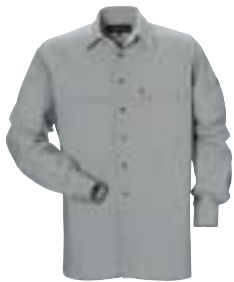
Fjällräven - Alec Shirt ↑