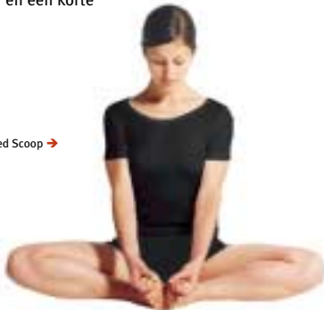
Icebreaker - Skin Short sleeved Scoop →