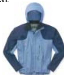
Mountain Hardware - Tenacity light Jacket ↑