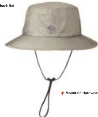
↑ Mountain Hardwear - Epic Bucket