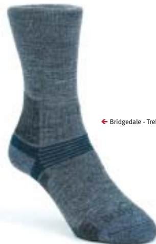
← Bridgedale - Trekker