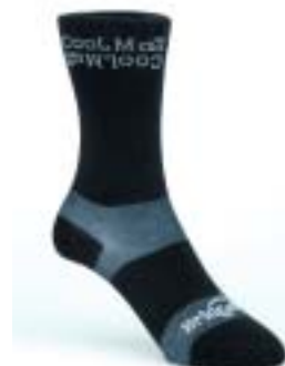
Bridgedale - AT Coolmax Liner ↑