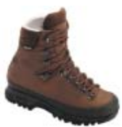
↑ Hanwag - Alaska Top GTX