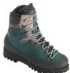
Hanwag - Annapurna GTX →