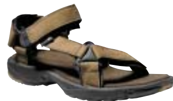
Teva - Circuit Leather ↑