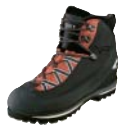
Millet - Rock & Ice GTX ↓