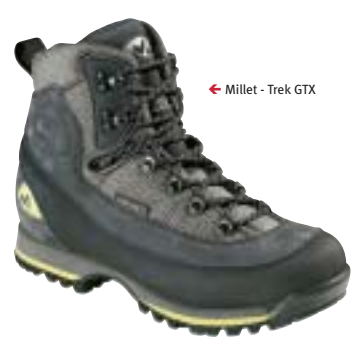
← Millet - Trek GTX