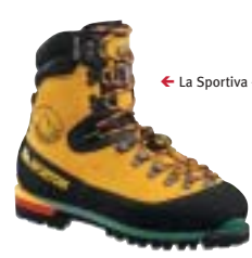
← La Sportiva - Nepal Top