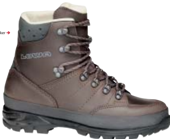
Lowa - Trekker →