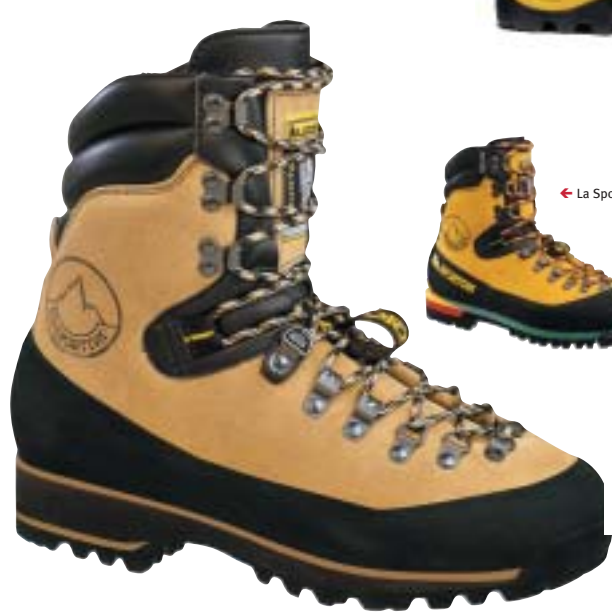
La Sportiva - Nepal Light →