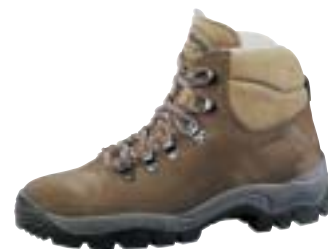
Meindl - Jersey ↑