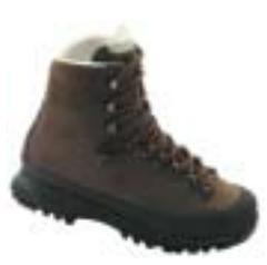
↑ Hanwag - Yukon