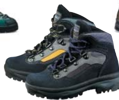
↑ Meindl - Manitoba