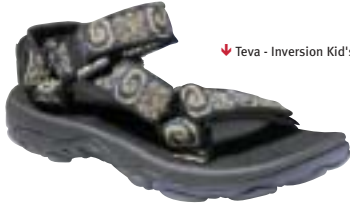
↓ Teva - Inversion Kid's