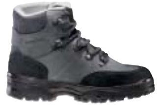
↓ Lowa - Walky