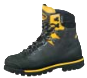
Meindl - Mt Crack Pro ↑