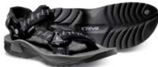
Teva - Stratum ↑