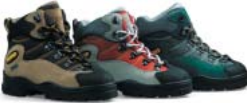
↑ Asolo - Tiger GTX