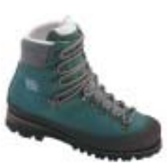
↑ Hanwag - Tibet