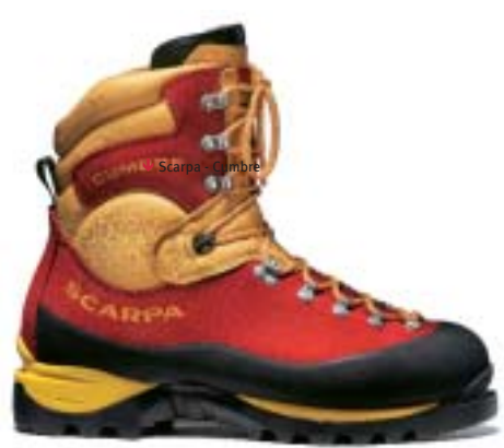
Scarpa - Cumbre