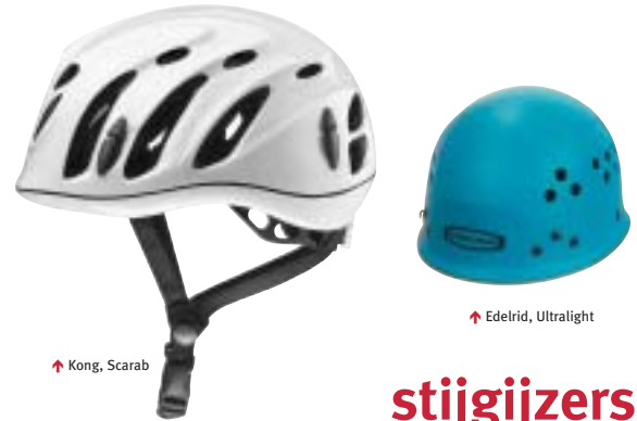
↑ Kong, Scarab