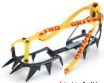
↑ Grivel, G12 New Matic

Tip: De scherpe punten van uw stijgijzers kunnen veel schade aanrichten. Gebruik voor het vervoer (ook in het terrein) een stijgijzerzak: dit werkt snel en veilig. Bovendien kunnen er ook ijsschroeven in de zak bewaard worden.