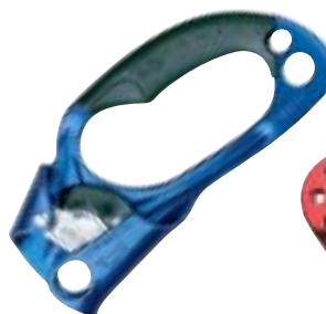
↑ Petzl, Ascension