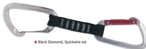
↑ Black Diamond, Quickwire set