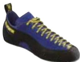
↑ La Sportiva, Cliff Blue