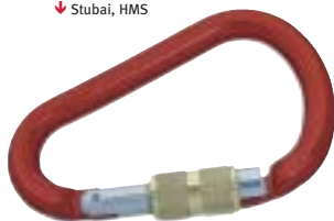
↓ Stubai, HMS

Zo kunnen veel zekeringsmiddelen ook worden gebruikt als afdaalhulp. Dynamische zekeringsapparaten zorgen ervoor dat de klap (vangstoot) op de zekeringsketen wordt beperkt. Ze verlagen de spanningspiek op de zekeringsketen doordat het touw door de zekering glipt (wrijving) en zo als een rem werkt. Wij hebben de belangrijkste zekeringsapparaten op een rijtje gezet: