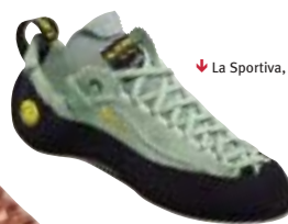
↓ La Sportiva, Mythos Lady