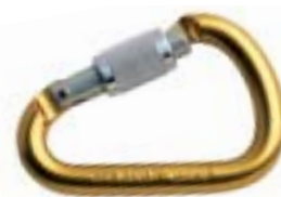
↑ Petzl, Attache