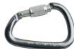
↑ Petzl, William Lock