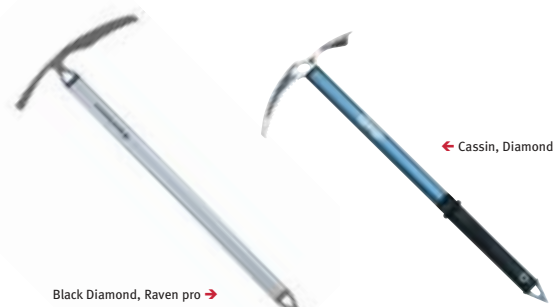
Black Diamond, Raven pro →