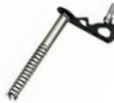
↑ Black Diamond, Turbo Express Ice Screw