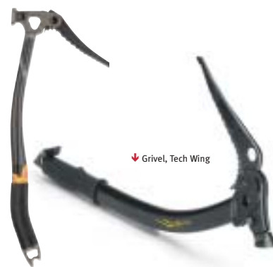
↓ Grivel, Tech Wing

Voor al deze bijlen hebben wij een groot aantal onderdelen in voorraad zoals polsslussen, doorns (voor verschillende typen ijs), schoffels, hamerkoppen. Informeer naar de vele mogelijkheden.