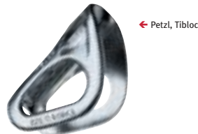
← Petzl, Tibloc