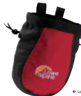
← Lowe Alpine, Zipper Dipper

Lowe Alpine Zipper Dipper Ruime pofzak met aantrekkoordje en tanka, inclusief ritszakje voor sleutels. (65194) € 9,95