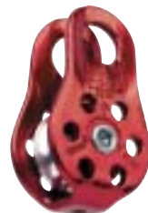
↑ Petzl, P05 Katrol Fixe