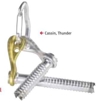
← Cassin, Thunder