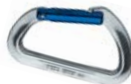
↑ Petzl, Spirit