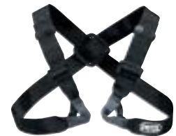
↑ Petzl, Voltige