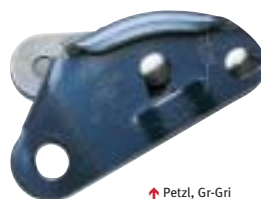
↑ Petzl, Gri-Gri

Petzl Basic Als de Ascension, maar zonder handvat. Alleen in rechtshandige uitvoering. (01907) € 40,50