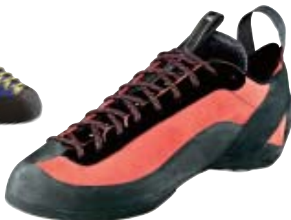
Millet, XK Lator →