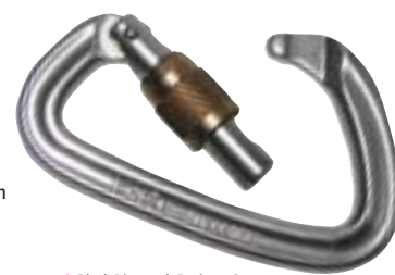
↑ Black Diamond, Positron Screw

Al enige jaren adviseren de opleiders van de Oostenrijkse berggidsenopleiding alleen nog maar gebruik te maken van karabiners die bij een geopende snapper een belasting kunnen verdragen van ten minste 8 kN. De CE-norm die echter geldt voor karabiners is 22 kN in de lengterichting met gesloten snapper, 6 kN bij dwarsbelasting en 7 kN in de lengterichting met 'open-snapperbelasting'. Alle gewone karabiners moeten deze waarde minimaal halen, en de bereikte waarden tijdens de tests moeten op de karabiner vermeld staan.