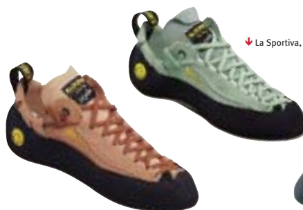
↑ La Sportiva, Mythos Man