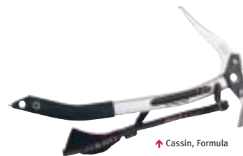
↑ Cassin, Formula