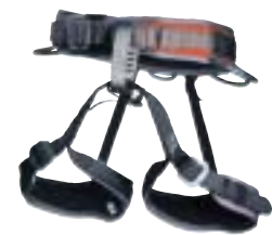
↑ Black Diamond, Momentum AL