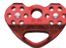
↓ Petzl, P21 Tandem