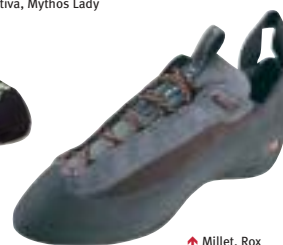
↑ Millet, Rox