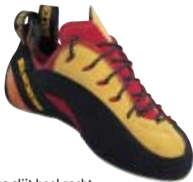
La Sportiva, Testarossa ↓

Helaas slijt heel zacht rubber sneller. Daarnaast bestaan er twee verschillende vormen wrijvingschoenen, rechte en kromme (toe-down). Deze laatste zal alleen voor de gevorderde klimmer zijn weggelegd, omdat de voeten in de schoen worden voorgekromd voor een nog beter contact met de wand. Let bij het passen van wrijvingschoenen erop dat ze niet te ruim mogen zitten. Voor de beginner adviseren wij de schoenen niet te strak te nemen, dat is vooral in het begin nog niet nodig en het gaat dan zeker ten koste van uw klimplezier.