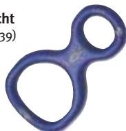
Lucky, abseilacht →