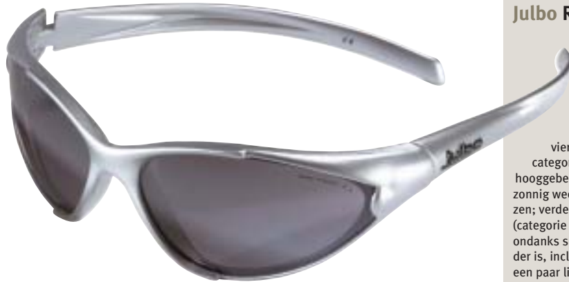
Julbo Reflex (ce4*)

Silver, vier paar lenzen. De Reflex van Julbo biedt de mogelijkheid de lenzen vrij eenvoudig te verwisselen. Hij heeft maar liefst vier paar lenzen; een paar categorie 4-lenzen, speciaal voor hooggebergte of gletsjer; voor elk zonnig weer een paar categorie 3-lenzen; verder een paar oranje lenzen (categorie 2) waarmee het zicht ondanks slecht weer verbluffend helder is, inclusief reliëf; en tenslotte een paar lichtblauwe lenzen (categorie 1) rustgevend voor ogen onder "slechte" weersomstandigheden. Waar je ook bent, u heeft altijd de juiste bril bij de hand.