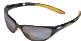
Julbo Aquila (ce3) Black, APX5 € 94,95