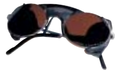
Julbo Micropores PT (ce4) Mat Silver, AAX8