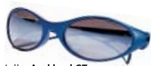
Julbo Auckland GT (ce3) Nok Blue, SX5 € 64,95