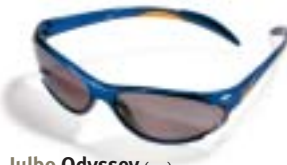
Julbo Odyssey (ce3) Flash Blue, APX5