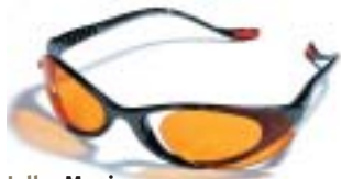
Julbo Magic (ce3*) Anthraciet, drie paar lenzen € 82,95

Er bestaat een grote diversiteit aan lenzen voor verschillende activiteiten. Alle lenzen beschermen 100% tegen UV-straling. Voor iedere activiteit bestaat er dus een passende bril. Voor wat betreft bescherming zijn lenzen opgedeeld in 5 categorieën. Van categorie 0, een blanke lens die alleen 100% UV-werend is tot en met categorie 4 (ce 4) dat een zeer donkere lens is die niet alleen 100% UV-werend is maar ook in grote mate het zichtbare licht (Visible Light=VL) en het infrarode licht (IR) tegen houdt. Categorie 4 is te donker om mee auto te rijden. Dit wordt dan ook sterk afgeraden. Met name sneeuw en water werken bijzonder reflecterend, waarbij uw ogen aan nog meer licht bloot komen te staan. In dit soort omgevingen is een goede bril dus een must. En dit geldt zeker ook voor kinderen.