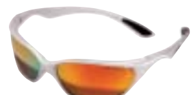
Julbo Boost L Silver, Multilayer Gold € 62,95