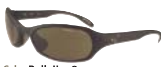
Cebe Bulb II 1789 (ce3) Zwart, grijs, lens 1500 € 65,00