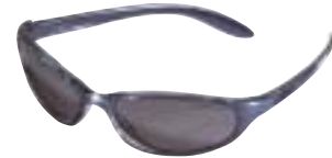
Julbo Sugar (ce3) Crystal Blue, SX5 € 42,95