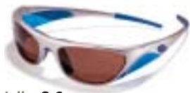
Julbo S-Cape (ce3) Mat Silver, AcrX4 € 94,95