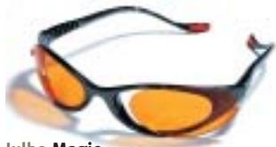
Julbo Magic (ce3*) Anthraciet, drie paar lenzen

Er bestaat een grote diversiteit aan lenzen voor verschillende activiteiten. Alle lenzen beschermen 100% tegen UV-straling. Voor iedere activiteit bestaat er dus een passende bril. Voor wat betreft bescherming zijn lenzen opgedeeld in 5 categorieën. Van categorie 0, een blanke lens die alleen 100% UV-werend is tot en met categorie 4 (ce 4) dat een zeer donkere lens is die niet alleen 100% UV-werend is maar ook in grote mate het zichtbare licht (Visible Light=VL) en het infrarode licht (IR) tegen houdt. Categorie 4 is te donker om mee auto te rijden. Dit wordt dan ook sterk afgeraden. Met name sneeuw en water werken bijzonder reflecterend, waarbij uw ogen aan nog meer licht bloot komen te staan. In dit soort omgevingen is een goede bril dus een must. En dit geldt zeker ook voor kinderen.