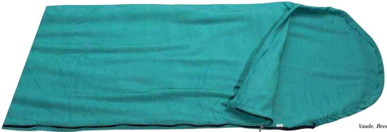
Vaude, Fleece lakenzak