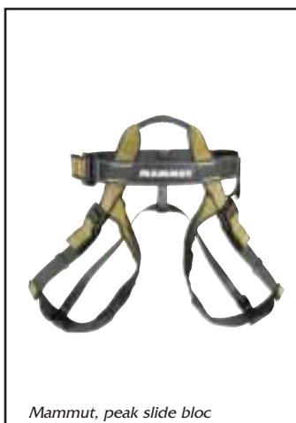
Mammut, peak slide bloc