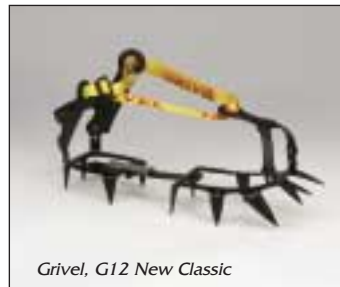
Grivel, G12 New Classic