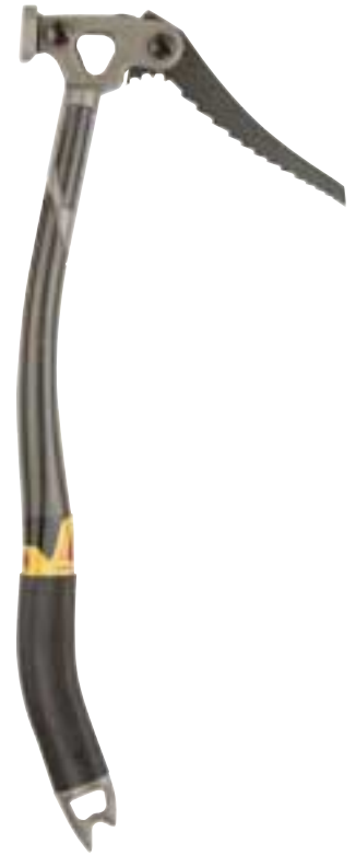
Black Diamond, Cobra