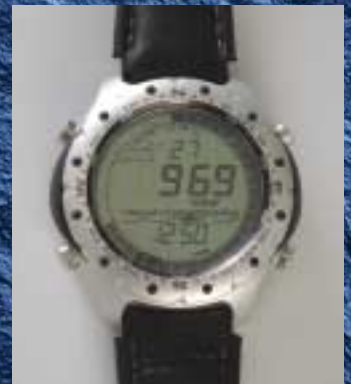
HORLOGES, PAGINA 70