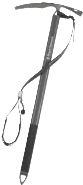
Black Diamond, Raven

Pickels worden o.a. gebruikt als sneeuwzekering (dodenman), voor voortbeweging en voor het hakken van treden. Deze diversiteit aan gebruiksmogelijkheden verklaart het grote assortiment. Tegenwoordig worden pickels en ijsbijlen in twee groepen verdeeld. Deze tweedeling heeft te maken met de verschillende gebruiksdoelen. De eerste groep bestaat uit basis- of standaardpickels. Deze groep wordt aangeduid met de letter B. Daarnaast bestaat de groep van de technische pickels (en ijsbijlen), aangegeven met de letter T. Deze pickels worden voor het zwaardere, vaak steilere werk ingezet. Het is dan ook vanzelfsprekend dat de groep van de technische pickels aan strengere normen onderhevig zijn. Zo wordt bij de standaardpickels de doorn en de punt niet getest, terwijl dat bij de technische pickels en ijsbijlen wel het geval is. Voor deze pickels leveren wij diverse accessoires als puntbeschermers, kopbeschermers, polslussen en polslusfixatie-systemen. Informeer naar de mogelijkheden.