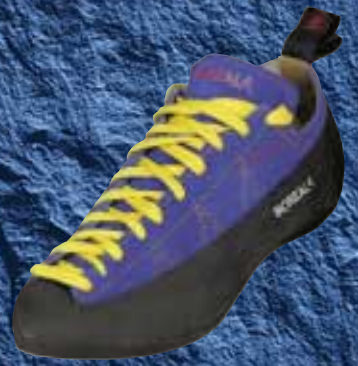
WRIJVINGSSCHOENEN, PAGINA 19