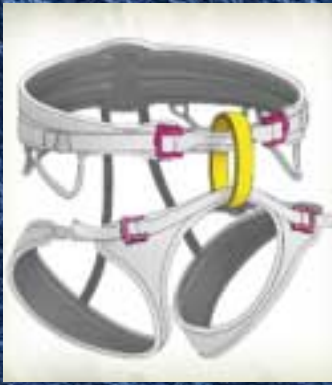
KLINGORDELS, PAGINA 64