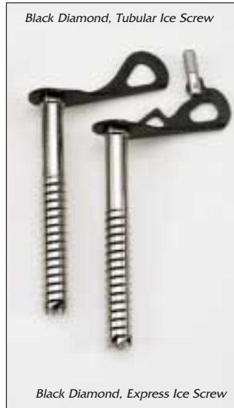
Black Diamond, Tubular Ice Screw