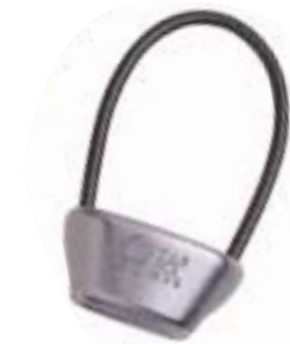
Black Diamond, ATC

Supersterk, mooi afgeronde randen, 8,2-11 mm. (26662) ( 18,13) f 39,95