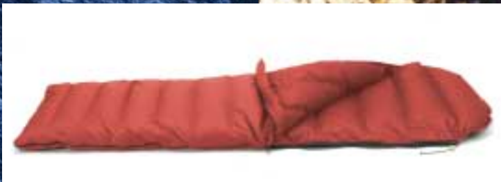
SLAAPZAKKEN, PAGINA 48