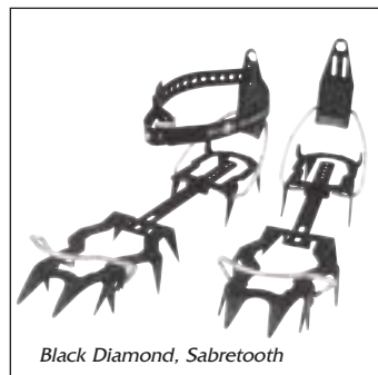
Black Diamond, Sabretooth