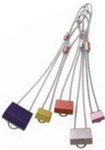
Black Diamond, Hexentrix Nuts

Hexentrix met kabel, maat 1 (49765) tot en met maat 11 (49775), prijzen vanaf ( 12,21) f 26,90