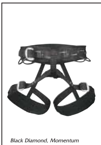
Black Diamond, Momentum