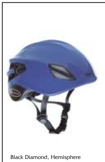
Black Diamond, Hemisphere