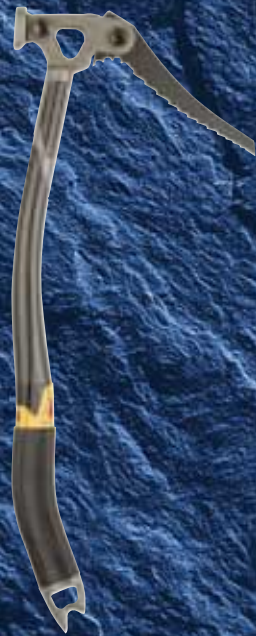
IJSBIJLEN, PAGINA 57