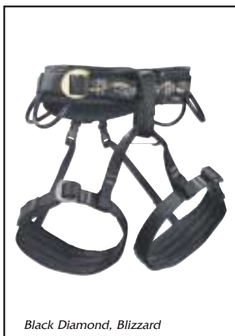
Black Diamond, Blizzard